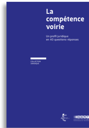
La compétence voirie (avril 2018)