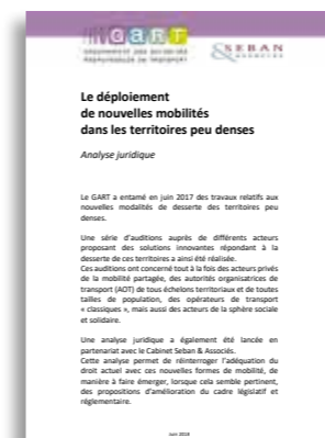
Le déploiement de nouvelles mobilités dans les territoires peu denses (juin 2018)