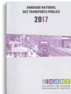
Annuaire national des transports publics 2017 (juillet 2018)