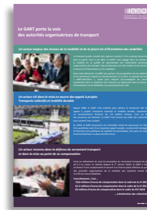
Feuillet de sensibilisation des actions du GART (juin 2018)