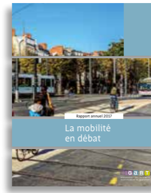
Rapport annuel 2017 (mai 2018)