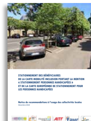
Notice de recommandations relative au stationnement des personnes handicapées (décembre 2018)