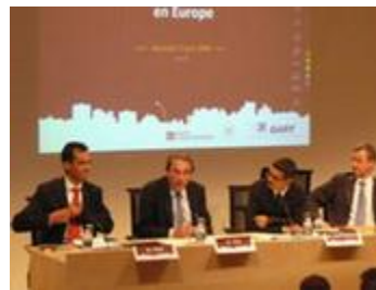
Colloque Financement du 17/06/2009

Ce colloque souhaitait stimuler les échanges d'expériences sur les systèmes de financement des transports publics urbains en Europe. Les débats se donnaient pour objectifs de répondre à la question suivante : « Quel système de financement des transports collectifs pour répondre aux objectifs de mobilité durable ? ».